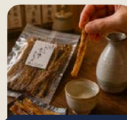
いわしスティック