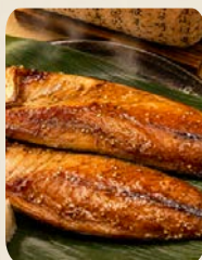
さばの醤油干し2枚 1,080円