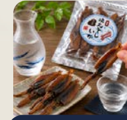
国産焼丸干しいか