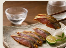
国産さばへしこ/たら糠漬