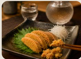
ふくの子糠漬/ふくの子粕漬