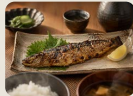
にしんの糠漬/いわしの糠漬