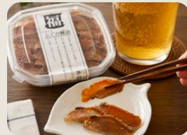
ふくの糠漬/ふくの粕漬