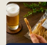
干し鱈スティック